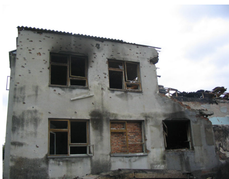
Школа, разрушенная в ходе теракта.

Первая причина, назовем ее объективной, заключается в том, что в мире есть благополучные и неблагополучные страны и регионы. В одних странах развита промышленность, транспорт, много материальных и духовных благ. В других, свирепствуют нищета, голод, болезни. Именно в таких регионах отчаявшиеся люди готовы к любым, даже непродуманным действиям. Главари террористов подсказывают – «виновники те, кто живет хорошо» и снабжают набранных «борцов» оружием и взрывчаткой. Большинство известных в мире террористов – выходцы именно из таких бедных стран и регионов. В благополучной стране возможны лишь одиночные акты психически неуравновешенных людей, но терроризм как явление слабо выражен.