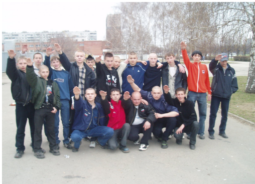
Группа подростков-скинхедов использует нацистское приветствие.

Свойственная этому возрасту идеализация, желание изменить мир, вера в свои силы и лучшее будущее, приводит к завышенности оценок и притязаний, мешает правильно оценить действительность, порождая пессимизм и апатию. Социальная активность подростка часто принимает форму абстрактной социальной критики, он фиксирует свое внимание на том, что его не удовлетворяет, что не соответствует его идеалу. Примером может служить резкость и безапелляционность критических суждений о ситуации в стране, в республике, в городе или поселке, в школе. Это состояние стараются использовать различного рода политические и религиозные течения, пытаясь внушить подростку, что все недостатки, которые он видит, могут быть устранены путем радикальных действий.