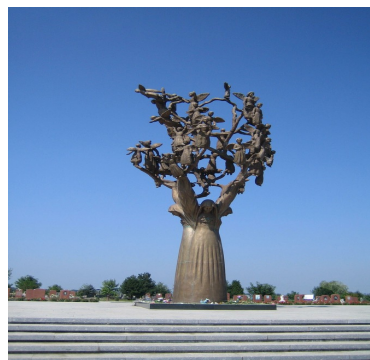
Памятник детям, погибшим во время теракта в г.Беслане.

Когда жизнь людей уносит болезнь – такова судьба или воля Всевышнего. Когда человек гибнет в автокатастрофе, причина – невыполнение правил дорожного движения. Но в случае теракта, причина - воля других людей.