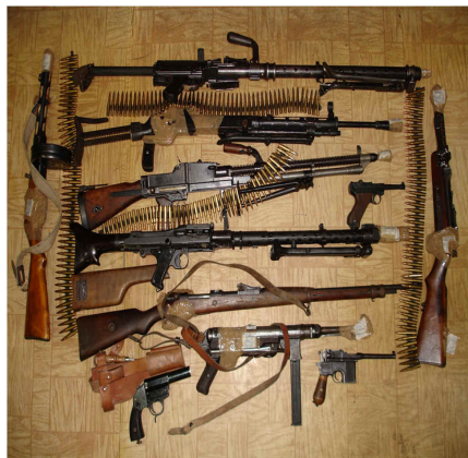
Оружие, изъятое у бандитов.

Некоторые бизнесмены готовы дать деньги террористам, чтобы устранить конкуренцию со стороны отдельных стран и областей. Например, террористический акт в курортном районе может привести к тому, что люди поедут отдыхать не туда, а в другую страну, которая и получит дополнительную прибыль. Или строители откажутся строить газопровод из-за угрозы терактов в одной стране и будут прокладывать его в соседнем регионе.