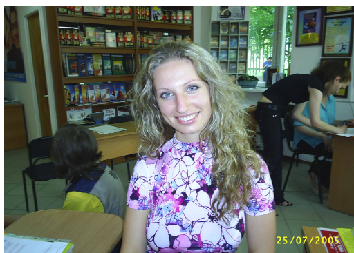
Новичков встречают улыбкой.

Принцип тоталитарной секты - затянуть человека в свои сети прежде, чем он что-нибудь о ней узнает. Когда же вербовщики затаскивают человека в секту, то их задача как раз обратная — «захлопнуть за ним дверь», пока он ничего еще не знает об их организации. Потому что если рассказать человеку, заполняющему «тест», что на самом деле он на долгие годы попадет в секту, будет днествовать и ночествовать в этой секте, что его могут заставить совершать преступления и почти наверняка заставят порвать со всеми родными и близкими, очень мало кто согласится пойти в эту секту.