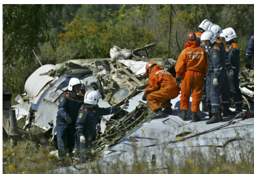
Самолет, взорванный террористами.

В современном мире, к сожалению, много страданий – болезни, преступления, экономические кризисы и войны. Когда умирает больной человек – родственники и друзья оплакивают его, когда погибает солдат с оружием – родина скорбит о нем. Но такая возможность предполагалась, ведь не все болезни мы можем лечить, а солдат, пожарный, милиционер – опасные профессии. Это печально, но соответствует тому, как люди воспринимают этот мир. Но, когда ночью по чьей-то злой воле взрывается жилой дом и погибают спящие в нем люди - рушиться справедливость мира.