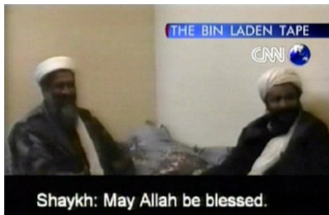
Американский телеканал CNN показывает выступление международного террориста Бен Ладена.

распространения информации и влияния на людей. Из СМИ люди узнают о мире, о мнениях, чувствах и поведении других людей. СМИ, таким образом, способно задавать настроение и определять поведение огромных групп людей. У людей есть потребность в познании окружающего мира и эту важную потребность удовлетворяют СМИ.