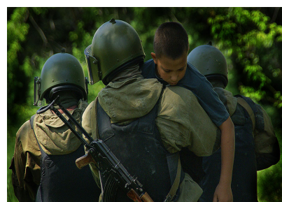
Бойцы спецназа освободили ребенка из рук террористов.