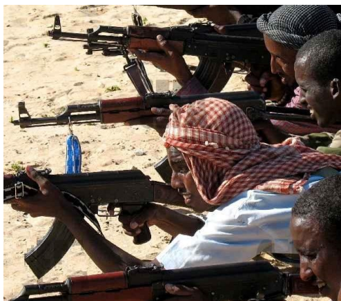
Подготовка в международных лагерях террористов.

слова «борцы за свободу», «бойцы сопротивления», «воины Аллаха», «народные мстители».