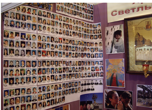
Фотографии детей и взрослых, которых террористы захватили в заложники в школе г. Беслан, а потом убили.

Прежде всего, к терроризму приходят люди с «суженным» сознанием. Они ясно, четко воспринимают, представляют одну мысль, идею. Эта может быть религиозная идея или идея мести. Все остальное в окружающем