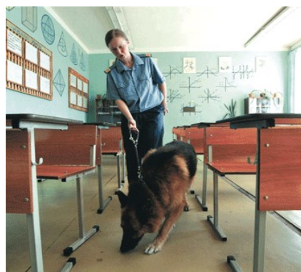
Кинолог с собакой обследует помещения школы.

➤ Каждый случай ложной тревоги тревожит мирных людей, беспокоит, мешает нормально жить. Опасаясь угрозы, эвакуируют школьников, студентов, работников предприятий, жителей домов. Перекрывают дороги, останавливают транспорт. Задерживают отправление