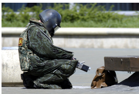
Сотрудник милиции в защитной экипировке специальной аппаратурой и исследует обнаруженный предмет.

Есть несколько практических советов, которые стоит запомнить и стараться соблюдать. Прежде всего, это касается обнаружения подозрительных предметов, которые могут оказаться взрывными устройствами. Подобные предметы обнаруживают в транспорте, на лестничных площадках, около дверей квартир, в учреждениях и общественных местах. Подросток, в силу наблюдательности, большого времени, которое он проводит на улице, в силу природной любопытности и тяги к