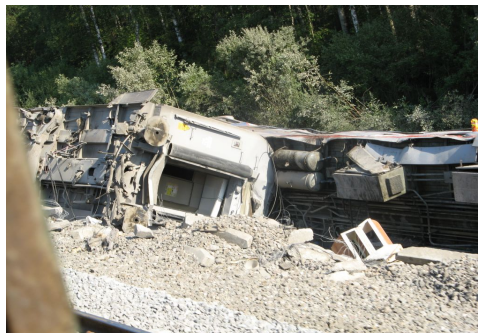
Результаты теракта на железной дороге.

Террористы часто используют оружие и взрывчатку, но это не война. Во время даже самых жестоких войн солдаты стараются не повреждать школы, больницы, религиозные здания и жилые дома. Так как на этот счет существуют жесткие правила ведения войны. Если солдат стреляет по мирным жителям, то такой солдат подлежит строгому суду и жестокому наказанию. Иначе обстоит дело у террористов. Совершая преступления, террористы выбирают такие безопасные для себя места, как больницы, школы, театры, концертные площадки, рынки. Чем больше среди людей,