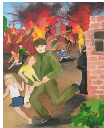
Детский рисунок теракта.