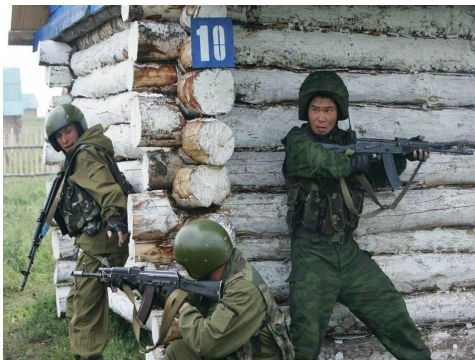
Бойцы группы антитеррора проводят учения по поиску и задержанию террористов.

Это позволяло террористам чувствовать себя безнаказанно и поощряло их к новым террористическим атакам. У современных спецслужб есть возможности не дать террористам уйти, и одновременно обеспечить максимально возможную безопасность заложникам. Большинство терактов последних лет с захватом заложников закончились уничтожением или арестом террористов.